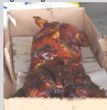
Nach dem Spiel lud die SGS Landhaus zur Abschlussfeier