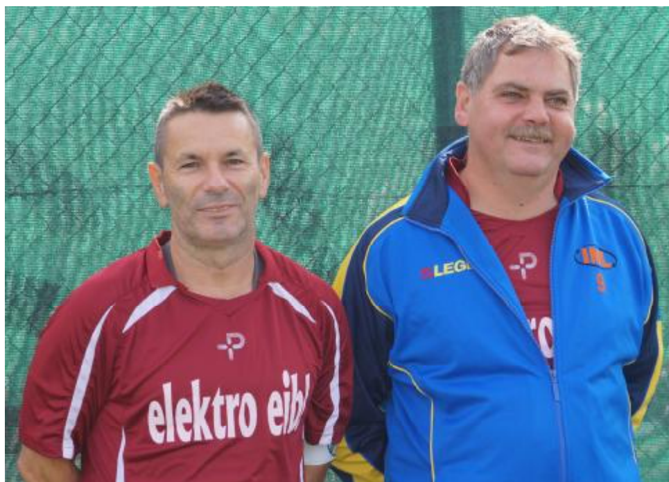
Der SGS Paradesturm vom Helfortplatz:

Torfolge: 1:0 (15.) HM, 1:1 Wieneritsch P. (30.), 1:2 Zimmerl (33.), 1:3 Breiteneder (48.), 1:4 Wieneritsch P. (60.), 1:5 Mandl 72. DVE), 2:5 HM (73.).