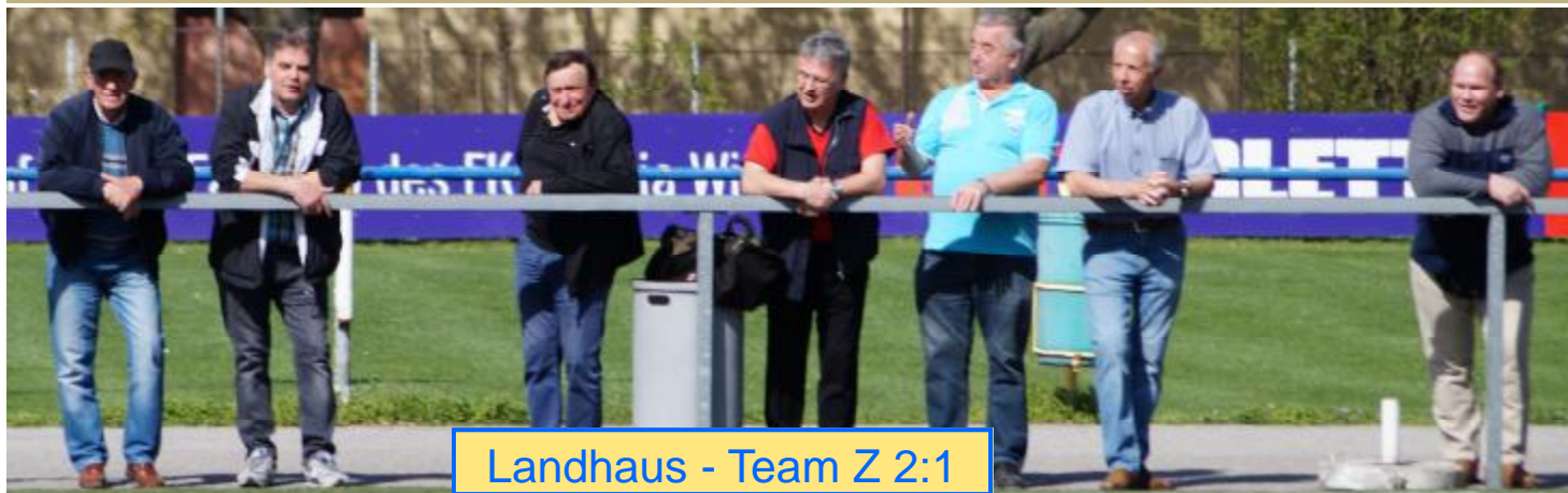
Landhaus - Team Z 2:1

Nach der Pause spielte dann nur noch die SGS, aber die Überlegenheit wurde erst in der 60. Minute durch den eingewechselten „Joker“ Krupitza - nach einem Traumheber von der linken Strafraumgrenze - zum 1:0 belohnt.